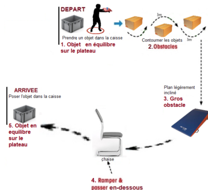
Exemple de parcours

Disposer dans une pièce de votre domicile la caisse remplie d'objets et la caisse vide dans une autre pièce.